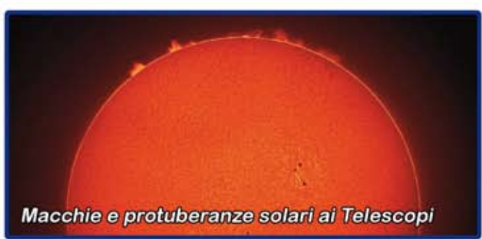
Macchie e protuberanze solari ai Telescopi

Non è il classico Planetario, ma uno straordinario simulatore del cielo stellato e di tutte le costellazioni, capace di proiettare in full HD affascinanti animazioni e filmati 3D , inesauribile strumento per l'apprendimento e le potenzialità educative, impareggiabile per le emozioni che può suscitare. Le lezioni sono curate dal fisico e planetarista .