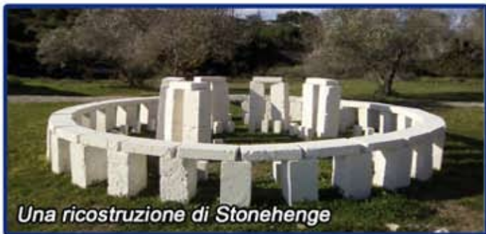
Una ricostruzione di Stonehenge