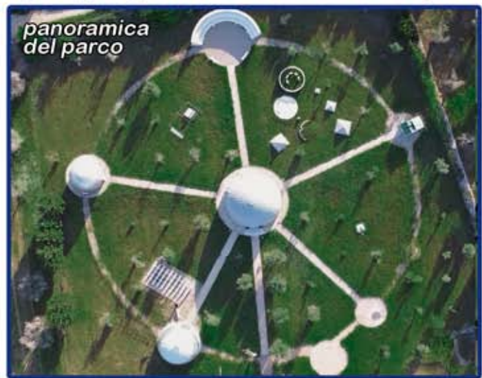
panoramica del parco

c/o il più grande e attrezzato parco astronomico del salento e della puglia