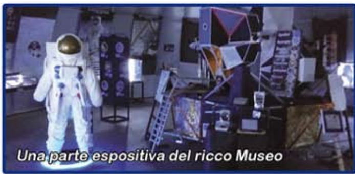
Una parte espositiva del ricco Museo