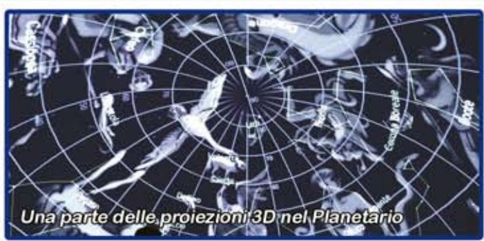
Una parte delle proiezioni 3D nel Planetario

ecco le attività proposte nel percorso didattico "un giorno... da Astronomi" tariffa: euro 7,00/alunno-studente, durata: 2,5/3 ore, max capienza: 110 persone le attività sono anche personalizzabili secondo le vs esigenze: