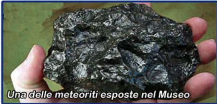
Una delle meteoriti esposte nel Museo