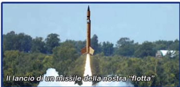
Il lancio di un missile della nostra "flotta"