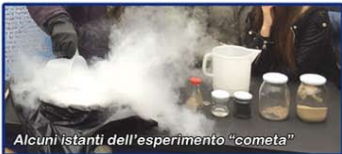
Alcuni istanti dell'esperimento "cometa"

Laboratori didattici aggiuntivi con il coinvolgimento pratico di alunni e studenti