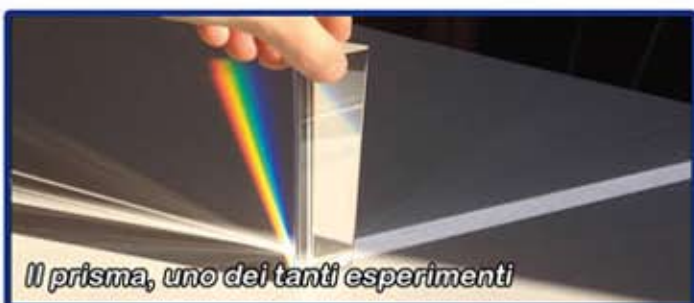
Il prisma, uno dei tanti esperimenti