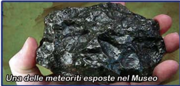
Una delle meteoriti esposte nel Museo