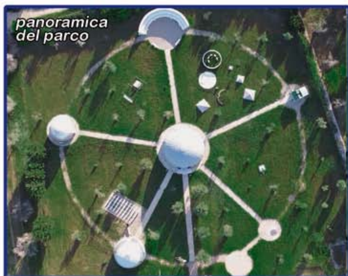
panoramica del parco

c/o il più grande e attrezzato parco astronomico del salento e della puglia