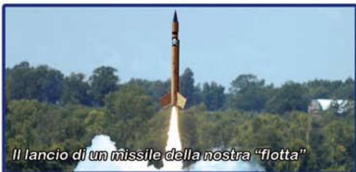
Il lancio di un missile della nostra "flotta"