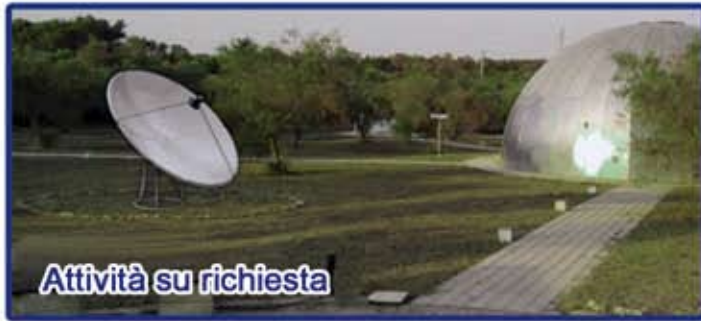
Attività su richiesta