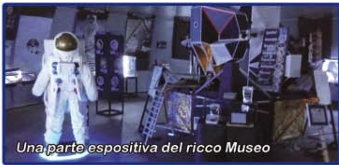
Una parte espositiva del ricco Museo