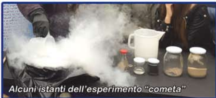
Alcuni istanti dell'esperimento "cometa"

Laboratori didattici aggiuntivi con il coinvolgimento pratico di alunni e studenti