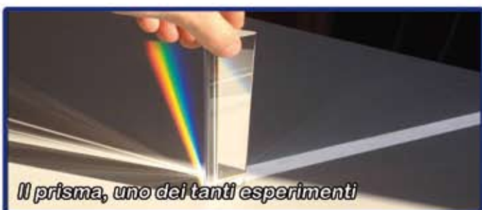
Il prisma, uno dei tanti esperimenti