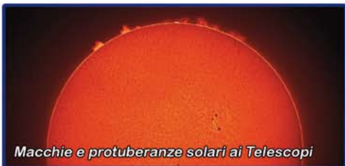
Macchie e protuberanze solari ai Telescopi