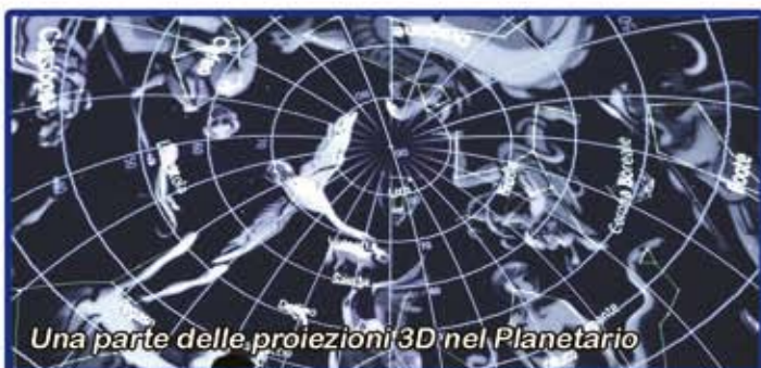
Una parte delle proiezioni 3D nel Planetario

le attività sono anche personalizzabili secondo le vs esigenze: