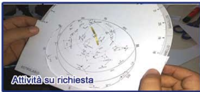
Attività su richiesta